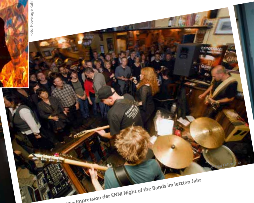
Partystimmung pur – Impression der ENNI Night of the Bands im letzten Jahr