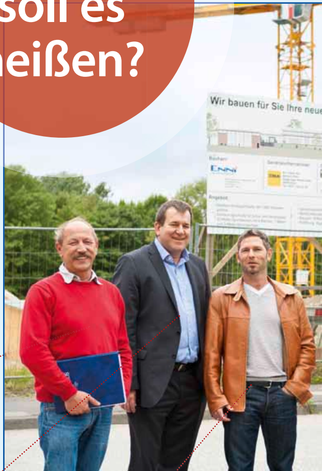
Sie hatten das vorletzte Wort: Die Jury hat ihre Arbeit getan – jetzt sind Sie dran!