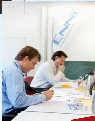
Die Qual der (Voraus-)Wahl: Viele gute Vorschläge waren zu prüfen.

Der Volleyball-Bundesligist Moerser SC findet dann endlich wieder eine bundesligataugliche Halle vor und kann seine Heimspiele tatsächlich zu Hause austragen. Auf der unteren Ebene kommen die