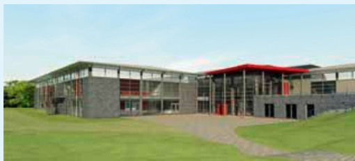
So wird es aussehen – und wie wird es heißen?

Das neue Kind der Moerser Sportwelt: Sportpark, Sportzentrum oder Sportcenter? Moers, Moers-Nord oder Rheinkamp? Das sind häufig genannte Bausteine für den neuen Namen. Wie setzt man die am griffigsten und attraktivsten zusammen? Eine Jury einigte sich auf fünf Vorschläge. Doch das letzte Wort haben die, für die der Neubau bestimmt ist: Sie.