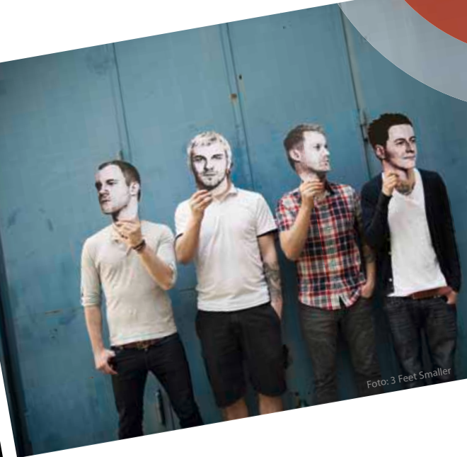
3 Feet Smaller