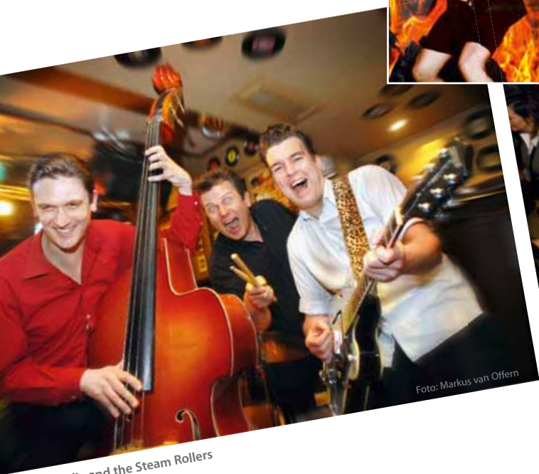
Colly and the Steam Rollers